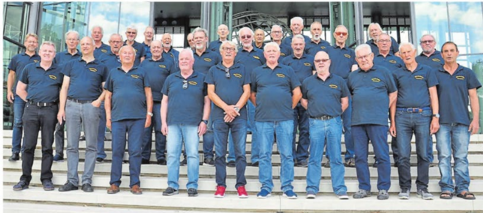
Der Männerchor Nordsee auf einer ihrer Chorfahrten in Wolfsburg.